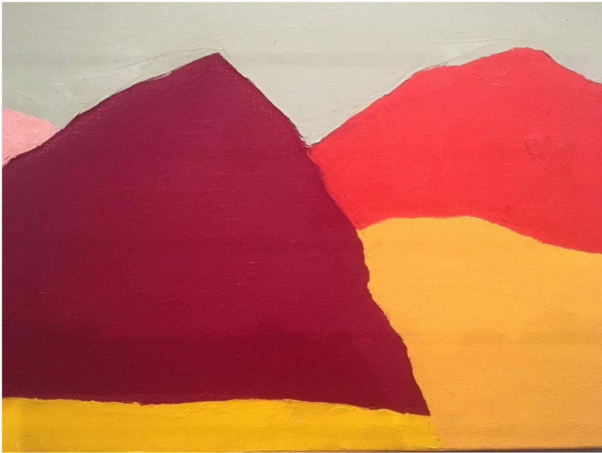
Etel Adnan, Untitled 2016